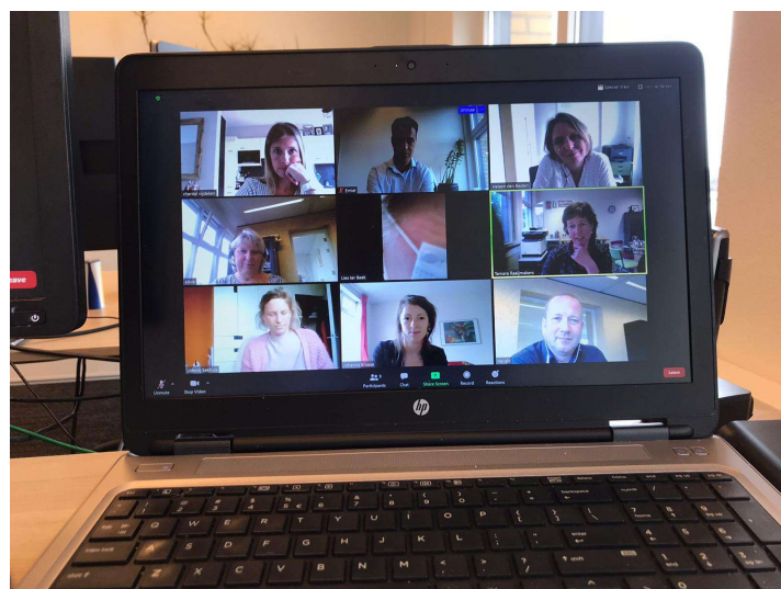
Online vergaderen met collega's van de Long Alliantie Nederland vanuit huis.

Tijdens de lockdown stonden gelukkig niet alle onderdelen van het onderzoek stil. In plaats van deelnemers te bezoeken, zijn via beeldbellen patiënten en mantelzorgers uit de interventieregio's geïnterviewd. Met deze interviews worden hun ervaringen met de ontvangen zorg en gesprekken met zorgverleners onderzocht. Een enkele keer was het vanwege gebrek aan een computer, smartphone of stabiel internet nodig om het interview telefonisch af te nemen, maar in de meeste gevallen lukte het goed om de deelnemers via beeldbellen te interviewen. Eind 2020 en begin 2021 zullen zorgverleners worden geïnterviewd over hun ervaringen met de implementatie van proactieve palliatieve zorg bij COPD in hun regio.