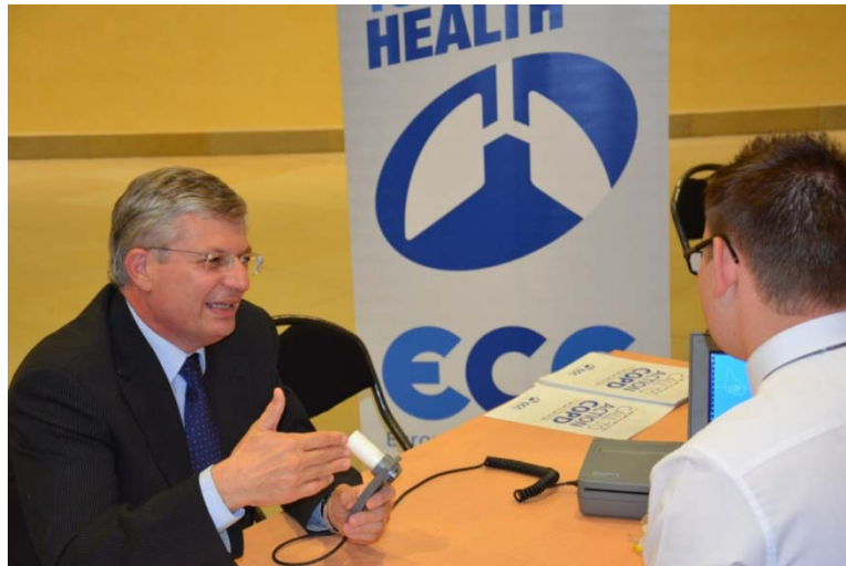
Eurocommissaris Borg ondergaat een longfunctieonderzoek

De European COPD heeft als missie het strijden tegen bestaande mythes en misverstanden over COPD, het coördineren van activiteiten van stakeholders voor het versterken van preventie, diagnosestelling, kwaliteit en toegankelijkheid van de COPD zorg door: