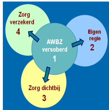
Afbeelding: vier beleidsvarianten voor de AWBZ

In de onderzoeken is niet gekeken naar de opbrengst van de zorg, zowel in kwaliteit van leven van miljoenen mensen en in geld. Ook is geen rekening gehouden met de voorkeuren van de Nederlandse bevolking, zo vindt het grootste deel van de bevolking dat bezuinigingen op zorg (en onderwijs) moeten worden vermeden. Het idee achter de heroverweging is dat politieke partijen de rapporten kunnen gebruiken voor hun verkiezingsprogramma's en dat kiezers mede op grond hiervan hun politieke voorkeur uitspreken. De twintig rapporten zijn te vinden op de website van het Ministerie van Financiën .